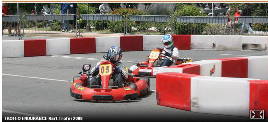
TROFEO ENDURANCE Kart Trofei 2009