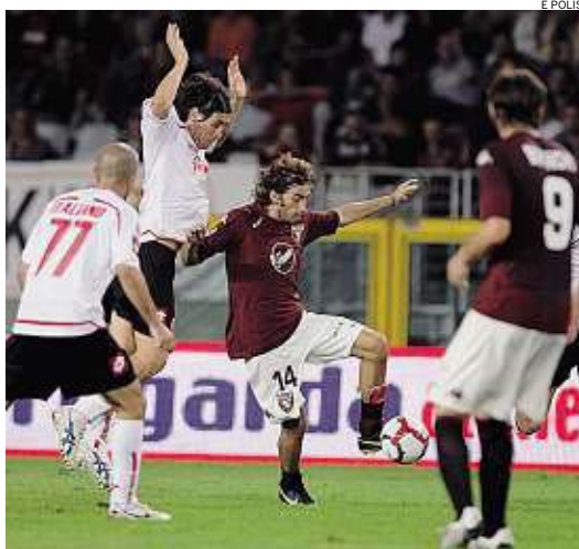
Il Toro cambia modulo per ritrovare la via dei tre punti