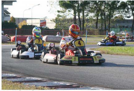
Gneo Racing arrivato terzo.

Il 24 Ottobre, sulla Pista Azzurra di Jesolo, si è vista, per la Quinta ed Ultima volta, la bandiera a scacchi, sventolare orgogliosa, verso il limpido cielo, al duecentoventiduesimo passaggio, sulla linea del traguardo, della flotta di kart, pilotati dai componenti delle squadre iscritte al Trofeo Endurance, decretando, così, il Team Vincitore dell'Edizione 2009.