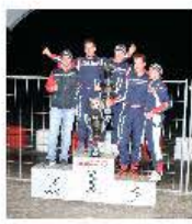
Nella foto, il Magic Freem Racing sul gradini più alto del podio

Il 16 ottobre, sulla Pista Azzurra di Jesolo, si è vista, per la quinta ed ultima volta, la bandiera a scacchi, sventolare, al duecentoventesimo passaggio, sulla linea del traguardo, della flotta di kart, pilotati dai componenti delle squadre iscritte al Trofeo Endurance, decretando, così, il Team Vincitore dell'Edizione 2010.