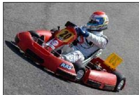
Il kart vincitore del team Nuvolari TV